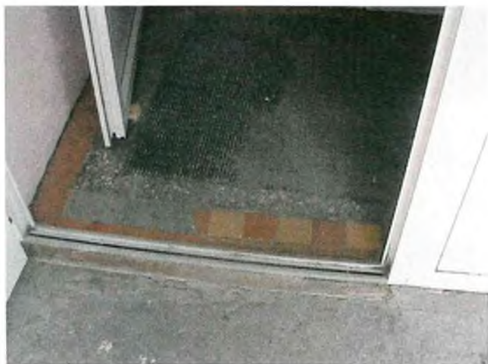
Фото № 4: Тамбур.